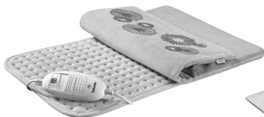
HK 45 Cosy