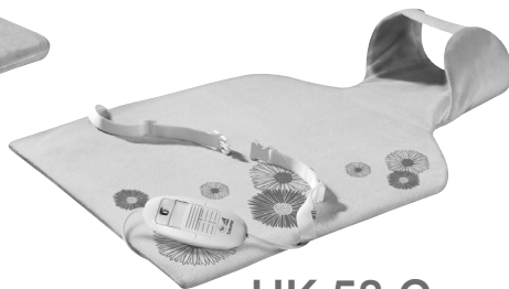
HK 58 Cosy