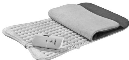
HK 115 Cosy