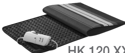
HK 120 XXL

RUS Электрическая грелка Инструкция по применению